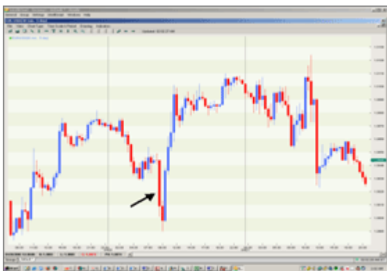
وضعیت EUR/USD پس از انتشار خبر (CPI) میانگین حرکت ۴۴ پیپ

ثابت کالاهای مصرف کننده را اندازه گیری می کند. میزان بالای این شاخص بر اقتصاد اثر منفی دارد. گاهی بانک مرکزی میزان تورم را با بالا بردن نرخ بهره تعدیل می نماید، اما گاهی جفت ارزها به تورم بالا به طرز مثبت عکس العمل نشان می دهند.