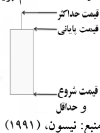
شکل (۲): یک شمعدان دم بریده سفید

از کنار هم قرار گرفتن خطوط منفرد، الگوهای ترکیبی شمعی حاصل می‌شود. الگوهای ترکیبی به دو نوع الگوهای برگشتی و ادامه‌دهنده ۱ تقسیم می‌شوند. وجود الگوهای ادامه‌دهنده حاکی از ادامه روند قبلی در آینده است و الگوهای برگشتی نمایان‌گر تغییر در جهت روند هستند. همه خطوط منفرد و الگوهای ادامه‌دهنده و برگشتی خود به دو نوع صعودی و نزولی ۲ تقسیم می‌گردند که به معنی صعود و نزول قیمت در آینده است.