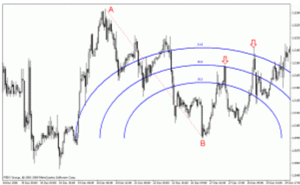
آموزش فیوناچی آرک سهم

فیوناچی Arcs ابزاری از گروه فیوناچی ها می باشد که درصد های تصحیح و بازگشت یک روند را بصورت کمانی نمایش نشان می دهد درصدهای عمومی مورد استفاده در این ابزار ۳۸/۲- ۵۰ و ۶۱/۸ درصد می باشند که کمان های برگشت قیمت را نسبت به یک روند صعودی یا نزولی نمایش می دهند.