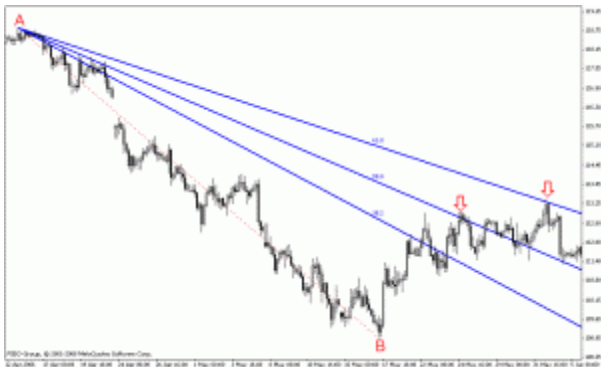
آموزش فیوناچی اکر سهم

فیوناچی Fan ابزاری دیگر از گروه ابزارهای فیوناچی می باشد که بر اساس زاویه روند غالب نقاط بازگشت را از برخورد خط های بادبزنی (فن) با قیمت بدست می آورد. در این ابزار نیز درجه های (درصدهای) ۳۸/۲- ۵۰ و ۶۱/۸ از اهمیت بیشتری برخوردار هستند.