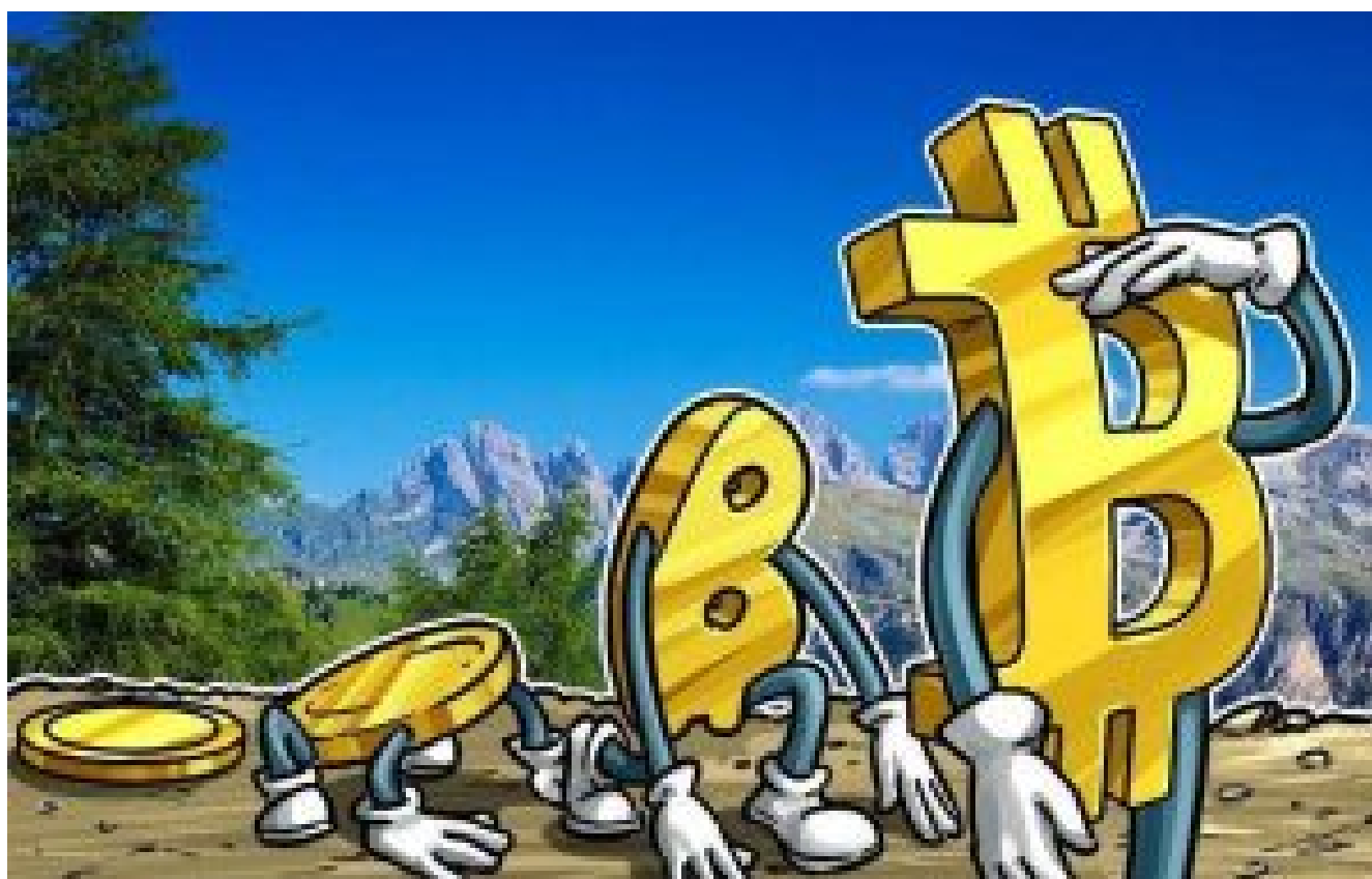
ویژگی های نسبی بیت کوین

این فاکتور ها از نظریه پرداز درباره کار سنتی عرضه نوآوری دریافت شده است و زمانی که با ویژگی های منحصر به فرد بیت کوین ترکیب شود، نتیجه می شود که بیت کوین اینجاست تا بماند و نه این که به همین زودی ها برود!